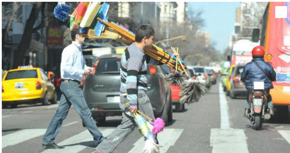
Tener trabajo. Inquieta tanto a nivel colectivo como personal.

Los datos surgen de una encuesta de Red Ciudadana Nuestra Córdoba. La lista sigue con pobreza, vivienda y salud.