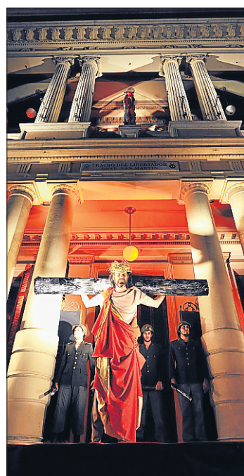
Jesús y la Policía. La puesta mixturó distintas épocas.